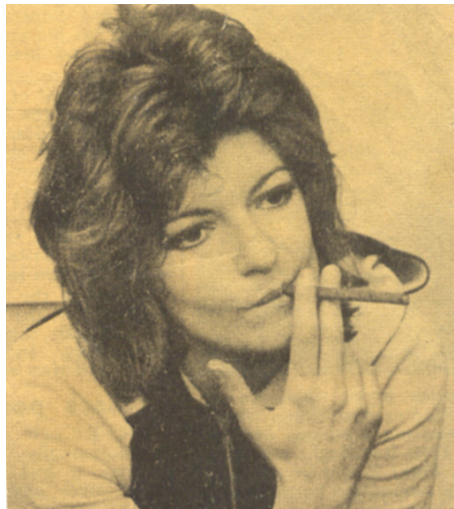
Buzz Goodbody – regista teatrale di Occupations